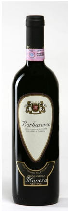
Barbaresco €16,50 ex btw