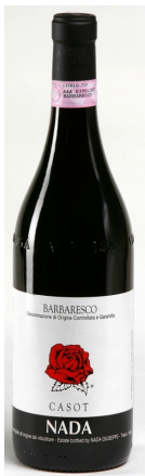
Barbaresco 'casot' €16,50 ex btw